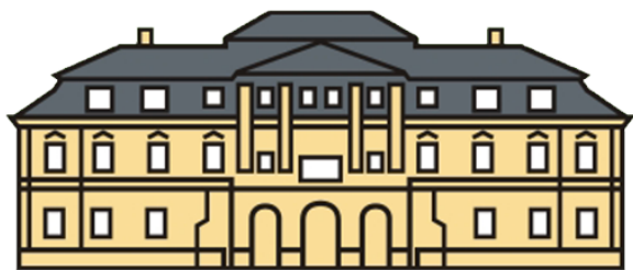
ODBORNÉ UČILIŠTĚ CHROUSTOVICE, ZÁMEK 1