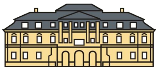
ODBORNÉ UČILIŠTĚ CHROUSTOVICE, ZÁMEK 1