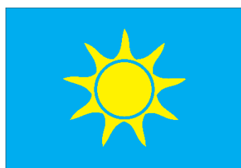
VESLAŘSKÝ KLUB PAPERSEK ÚSTÍ NAD LABEM